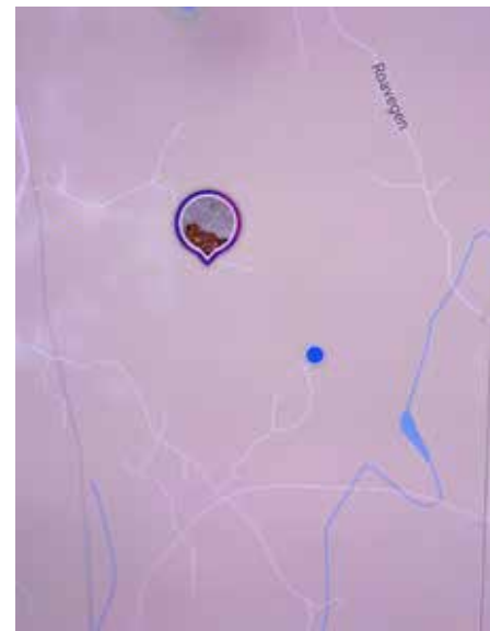
Kartet som kommer opp på smarttelefonen har lav kontrast og kan være vanskelig å se, spesielt i sollys.

I PAKKA FØLGER det med et CatSafe halsbånd med utløser ved belastning, men produsenten anbefaler å bruke hundens eget halsbånd. Åpningene på enheten, der halsbåndet skal tres inni, er på kun 16 mm, og så smale halsbånd er kun praktisk på miniatyrhunder. Et ønske for nye modeller er et solid hundehalsbånd som trackeren enten kan festes til eller puttes i en lomme på.